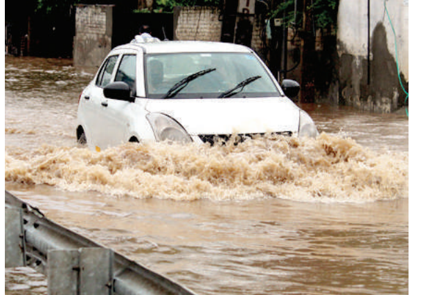
జార్కూడ, సుందర్ పూర్, నువాపా, నబరంగ్ పూర్లో భారీ వర్షాలు కురుస్తున్న వాతావరణ శాఖ అంచనా వేసింది.

ఒడిశా (జర్నలిస్ట్ ఫైల్) : ఒడిశాలో కుండపోత వర్షాలు కురుస్తున్న నేపథ్యంలో కొండపరియలు విరిగిపడటంతో మల్కంగిరి జిల్లాలోని 18 గ్రామాలకు ఇతర ప్రాంతాలతో సంబంధాలు తెగిపోయాయి. దీనిపై అధికారులు మీడియాతో మాట్లాడుతూ మల్కంగిరి జిల్లా కోరకొండ ఖాక్ పరిధిలోని బయపడర్ ఘాట్ రోడ్డులోని తుంబపర్ 1 గ్రామ సమీపంలో కొండపరియలు విరిగిపడటంతో మల్కంగిరి, కోరాపుట్లోని లమటాపుట్, నందాపూర్ ప్రాంతాల నుంచి వాహనాల రాకపోకలు నిలిచిపోయాయి. ఉత్తర ఒడిశాలోని గంగా మైదానాల్లో అల్పనీడన ప్రభావంతో.. జూలై 31 వరకు భారీ వర్షాలు కురిసే అవకాశం ఉందని భారత వాతావరణ శాఖ (ఐఎంఓ) బుర్రీన్ లో పేర్కొంది. అదివారం (నేడు) మల్కంగిరి, కోరాపుట్, నబరంగ్ పూర్, బోలంగీర్, నువాపాదా, సోన్ పూర్, ఝర్కూడ, సుందర్ పూర్, సంబల్ పూర్, కియోంజర్, అంగుల్, డియోగర్, కలహండి జిల్లాల్లో భారీ వర్షాలు కురిసే అవకాశం ఉందని వాతావరణ శాఖ కార్యాలయం తెలిపింది. అదివారం బంగాళాఖాతంలో గంటకు 40 నుంచి 50 కిలోమీటర్ల వేగంతో గాలులు వీస్తాయని ఐఎంఓ హెచ్చరించింది. సముద్రం అల్లకల్లోలంగా ఉండే అవకాశం ఉండటంతో మత్స్యకారులు సముద్రంలోకి వెళ్లవద్దని అధికారులు సూచించారు. బార్గడ్, జార్కూడ, సుందర్ పూర్, నువాపా, నబరంగ్ పూర్లో భారీ వర్షాలు కురుస్తున్న వాతావరణ శాఖ అంచనా వేసింది.