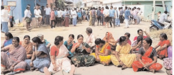
పులివెందుల జనవరి 17, జిల్లా పరిషత్ : పులివెందుల లోని నల్లపల్లె రెడ్డి గ్రామంలో ప్రజలు నిత్యవసర వస్తువులైన ప్రభుత్వ రేషన్ బియ్యం, కంది బేదలు, చక్కెర మరియు గ్రామంలో నీటి సౌకర్యం కూడా సరఫరా లేదని గ్రామస్థులు పులివెందుల వయా ముద్దిగుల్లి అనంతపురం రహదారిపై ధర్మా వహించారు ఇంతవరకు ప్రభుత్వాలు మారిన తమకు ఎటువంటి ఇబ్బంది లేదని ఎప్పుడు బియ్యం నిత్యవసర వస్తువులు కూడా సరిగా ఇవ్వలేదని వాటిని ఇచ్చినా కూడా ఇవ్వలేదని 7తేదీ వరకు మాత్రమే ఇస్తున్నారు. గ్రామస్థులు వాపోతున్నారు.