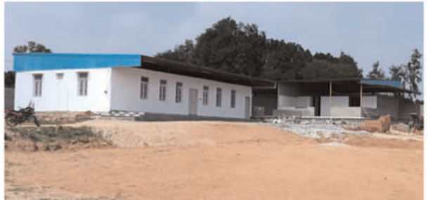
వి.కోట జనవరి 17, జిల్లా పరిషత్ : చిత్తూరు జిల్లా పోలవర మండలం తోటకనమ గ్రామపంచాయతీ దండి కుప్పం వద్ద దరఖాస్తు భూములలో అక్రమ కట్టడాలు నిజమేనని ఎట్టకేలకు తేలింది. స్థానిక తాసిల్దార్ భూములను పరిశీలించారు. రెవెన్యూ రికార్డుల మేరకు సుమారు 8